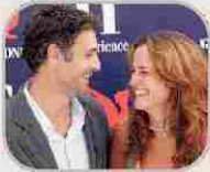
Raoul Bova «Io e Chiara abbiamo preso strade diverse. Crediamo troppo al valore della famiglia per tenerla in piedi a ogni costo, senza onestà»