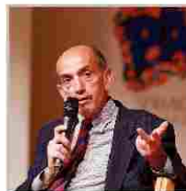
Domenico Quirico inviato de La Stampa

sente al Festival anche in un workshop con Domenico Quirico e Marco Bardazzi sui modi diversi di raccontare la stessa notizia, oltre che nell'incontro con i fotografi Pietro Masturzo, Davide Monteleone e Riccardo Venturi sul suo libro «A occhi aperti».