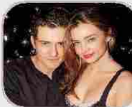
Orlando Bloom e Miranda Kerr «La vita spesso non funziona come avevi previsto o sperato. Siamo una famiglia. Non c'è dubbio che continueremo a sostenerci l'uno con l'altro»