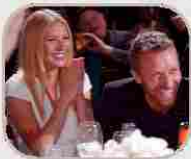
Gwyneth & Chris Paltrow e Martin, sposati dal 2003, hanno firmato insieme l'annuncio della loro rottura e l'hanno intitolato «Separazione consapevole»