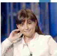
Laura Boldrini Presidente della Camera

Ho molte perplessità sull'utero in affitto: è pratica vietata in questo Paese e resta vietata